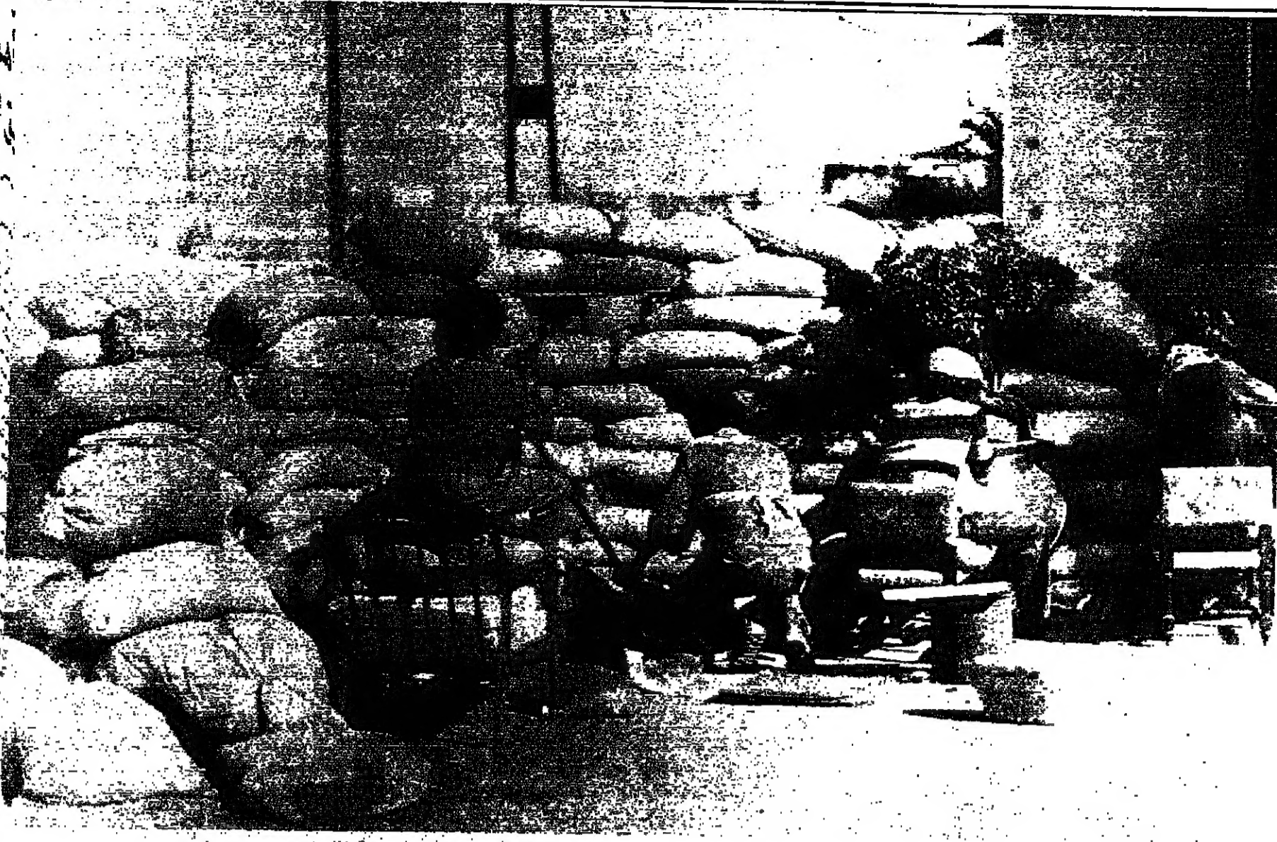
مسلحون وراء متراس في مواجهة الحزام القرمزي على الزيتون